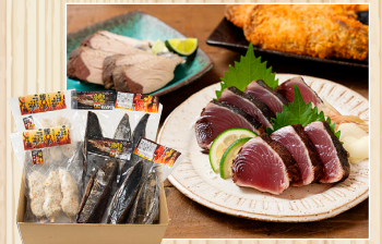
カツオぜよ! 土佐流カツオギフトセット 2023限定版! 株マルキョウ