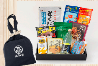
土佐の気持ちやき! SDGs土佐風呂ギフトセット 株G&F