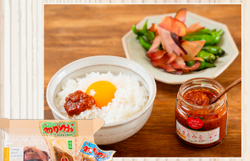
かつおとトマトの びっくりセット 株(特非)日高わのわ会

※ギフトの販売について/注文受付のみ又は展示のみの商品もありますので、予めご了承ください。