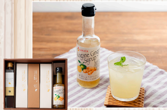
しょうがショウガ生姜! しょうがづくしの 「黄金しょうがギフトセット」 株坂田信夫商店

「あなたが贈りたい、もらいたい新しい高知のギフトセット」をコンセプトに行われたコンクール。高知県内の事業者から応募された多くの魅力的なギフトの中から選ばれたのが「高知を贈ろうギフト15選」です。(掲載は応募順)