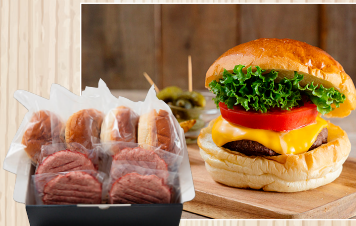
お家で作ろう! 土佐あかうしバーガー 株グラディア