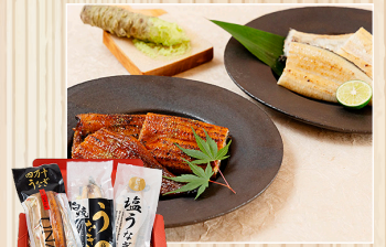
四万十うなぎ うまいもの大賞 3年連続受賞セット 四万十うなぎ販売(株)