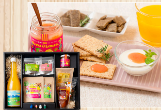
「げんきにしゅうかね?」 こうちからのやさしいギフト 株(一社)エンジェルガーデン南国