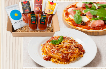
こころもからだも 大喜び 株(特非)日高わのわ会