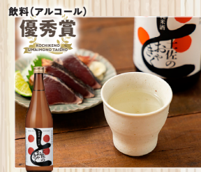
無濾過 純米酒 土佐のおきやく 土佐鶴酒造(株)