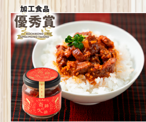
土佐あかうし 奇跡のラー油 (有)藤川工務店