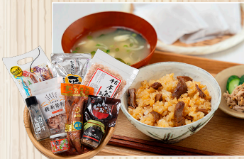
かつおづくしで尽くします! かつおモリモリ!ギフトセット 株鯉船