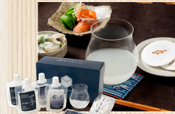
四万十薫る 純米大吟醸ギフト 文本酒造(株)