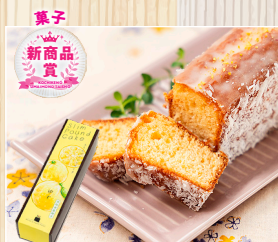
スリムパウンドケーキ 柚子 Maison de Sweets Hattori