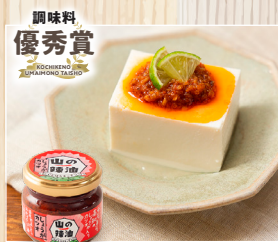
山の辣油 しょうがカツオ 株式会社いしはらキッチン