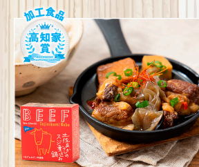
土佐あかうしの スジ煮込み鍋 (株)黒潮町佐詰製作所