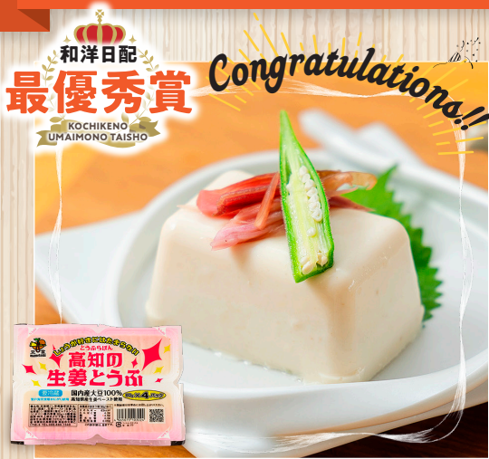
高知の生姜とうふ (有)高橋豆腐