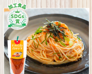
かつおだし香る にんにくと トマトみそのパスタソース (特非)日高わの会