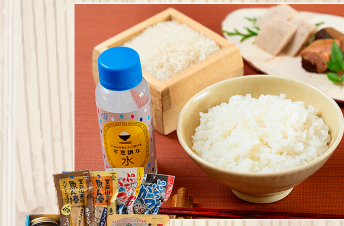
空と海の シンフォニア 室戸海洋深層水(株)