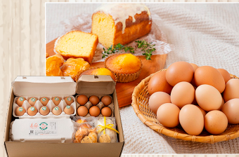
こだわりの土佐ジローで作った 安心安全おいしい おやつとたまごのセット 裏庭たまごとハーブ