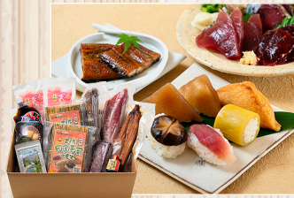
家で高知のおきゃくが できるぞね!セット 株末広