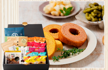
創業明治7年 城西館オリジナルギフト 株城西館