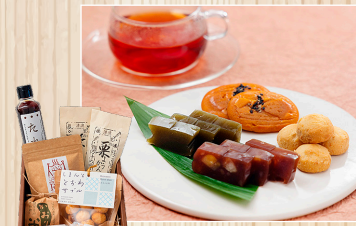
しまんとのなかま ギフトセット 株四万十ドラマ