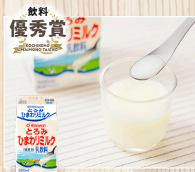
とろみ ひまわりミルク ひまわり乳業(株)