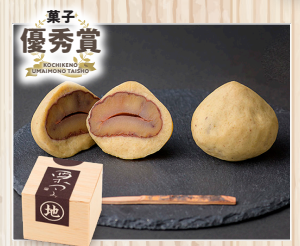
栗つつみ (株)四万十ドラマ